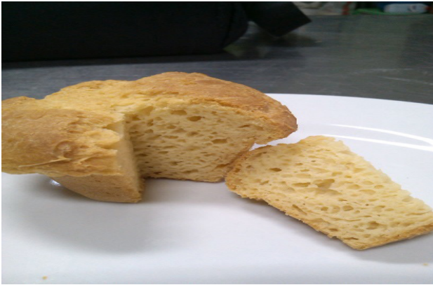
Gambar 2. Produk Roti Tawar Non Gluten Terpilih

pengolahan bahan yang dilakukan sudah cukup baik. Hal ini sejalan dengan apa yang telah dilakukan dalam pengolahan roti tawar. Setiap pengolahan dilakukan menggunakan alat, sehingga kontaminasi yang berasal dari tangan dapat diminimalisir. Selain itu proses pemanasan, dalam hal ini pemanggangan roti akan membantu mengurangi jumlah mikroorganisme yang ada. Menurut Subchi (2011), pemanasan yang dilakukan pada suhu 190,6^{\circ}\text{C} selama 25 menit dapat membunuh bakteri Staphylococcus aureus .