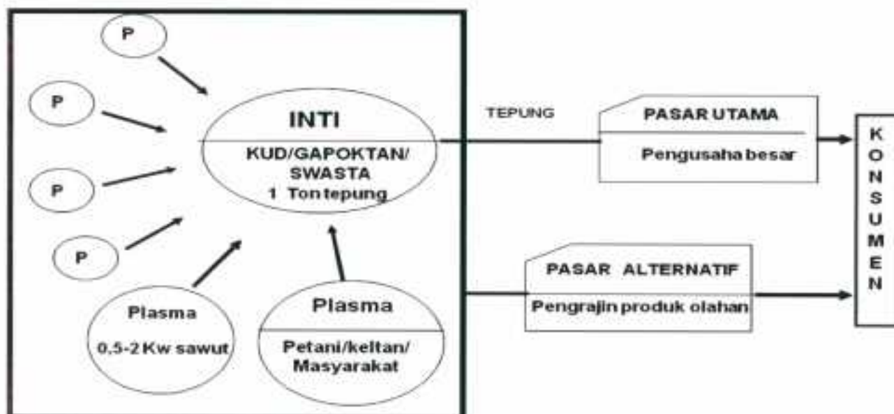
Gambar 2. Model Penerapan Teknologi Produksi Tepung Sukun

kelembagaan penerapan teknologi produksi tepung sukun seperti pada Gambar 2.