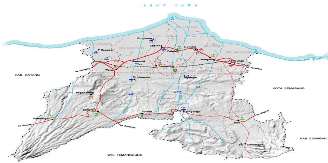
Gambar 1. Gambar Wilayah Kabupaten Kendal, Jawa Tengah

memengaruhi penerapan Kartu Tani; (iii) menganalisis efektivitas penerapan Kartu Tani dan efektivitas penyaluran pupuk bersubsidi, dan d) menganalisis pengaruh penerapan Kartu Tani terhadap efektivitas penyaluran pupuk bersubsidi.